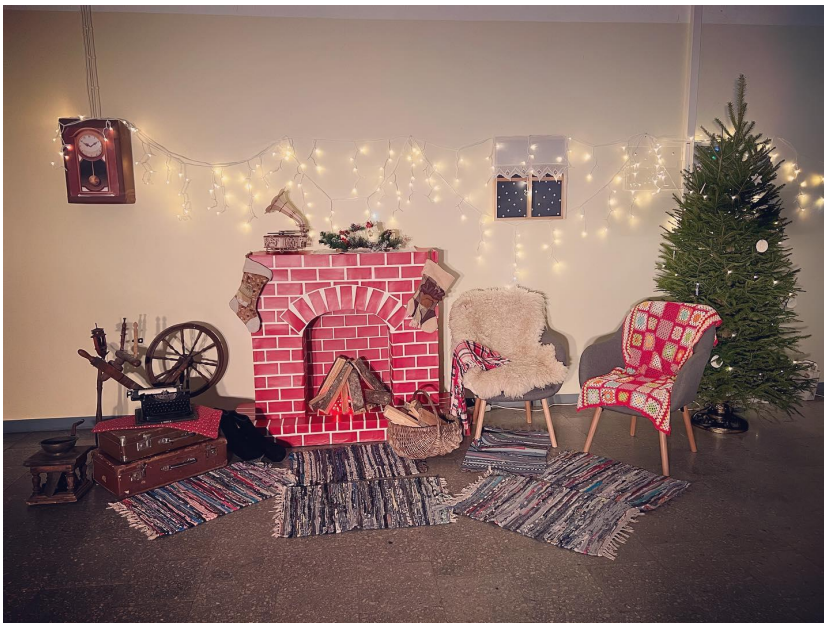
Joonis 24. Lille tn õppehoone jõulunurk 2021.