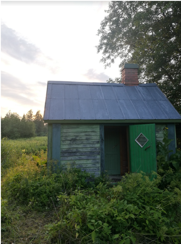
Joonis 25. Saunahoone 21. sajandi algusest.