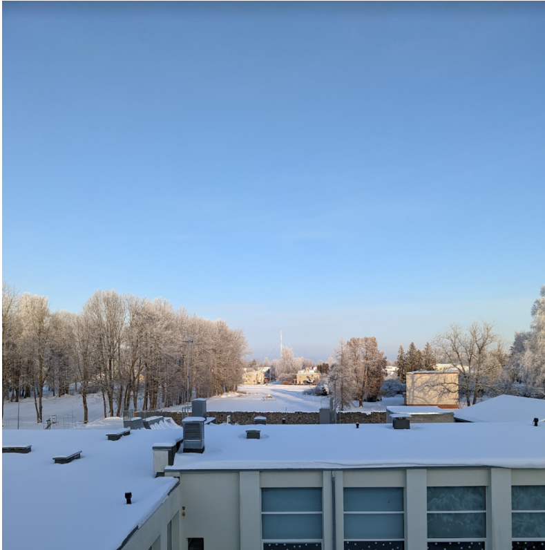
Joonis 23. Vaade ruumi 315 aknast 08.12.2021 pärastlõunal.