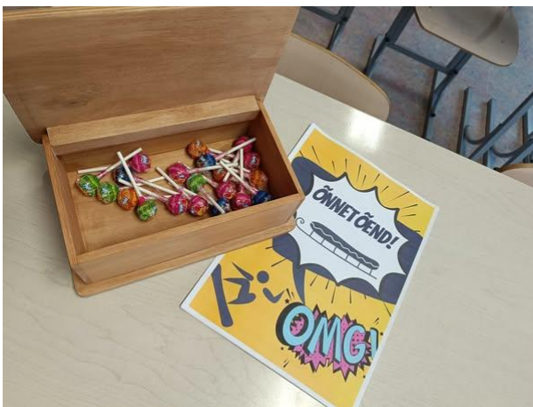
Joonis 3. Vastla Jaht Adavere õppekohas.