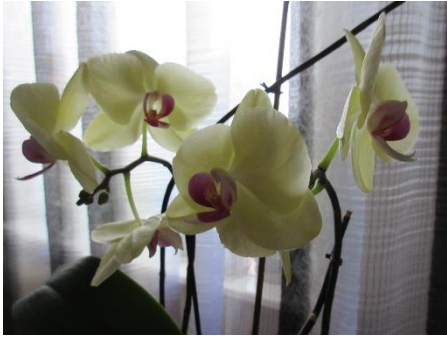
Joonis 2. Orhidee.